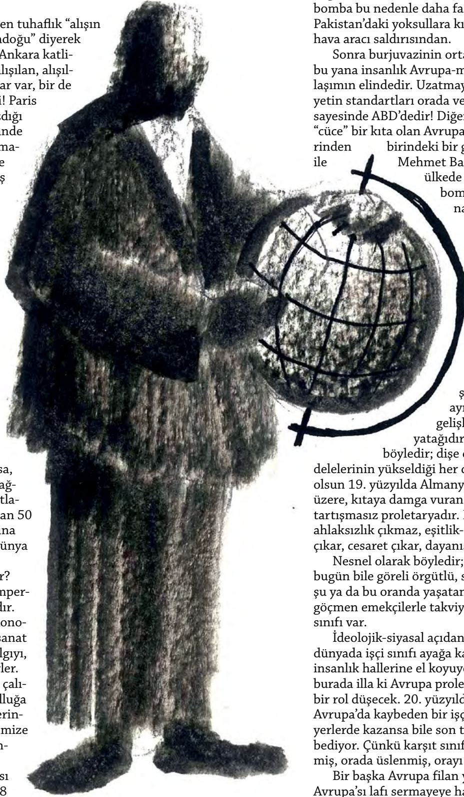
Çizim: Ömer Koçağ

Fransa'da patlayan bombanın Nijerya'da patlayan bombadan daha önemli hale gelmesini mazur gösterebilecek tek şey işte