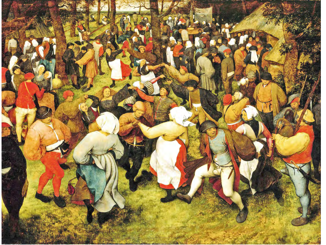
Pieter Bruegel'in 1566 tarihli "Düğün Dansı" adlı tablosu o dönemde kilisenin tasvir etmediği danslı bir köy eğlencesini yansıttıyor

Laikleşme süreci Avrupa'da modern dönemin başlamasıyla paralel olarak ilerler. Modern dönemden kasıt kapitalist üretim ilişkilerinin geliştiği ve bu ilişkilere uygun üstyapısal dönüşümlerin yaşanmaya başladığı tarihsel dilimdir. Bu dönüşümlerden biri kapitalist pazarın ulusal çapta örgütlenmesi ile mutlak monarşilerin ortaya çıkmasıdır. Mutlak monarklar güçlerini ulusal pazar olarak örgütlenmiş coğrafyalara hükmetmekten alırken bir yandan da ulusal kapitalizmin içeride ve dışarıda yayılması için gereken siyasal ve hukuki düzenlemeleri yaparak kapitalizmin önünü açmışlardır. Ulusal monarşilerin ortaya çıkışı, feodal