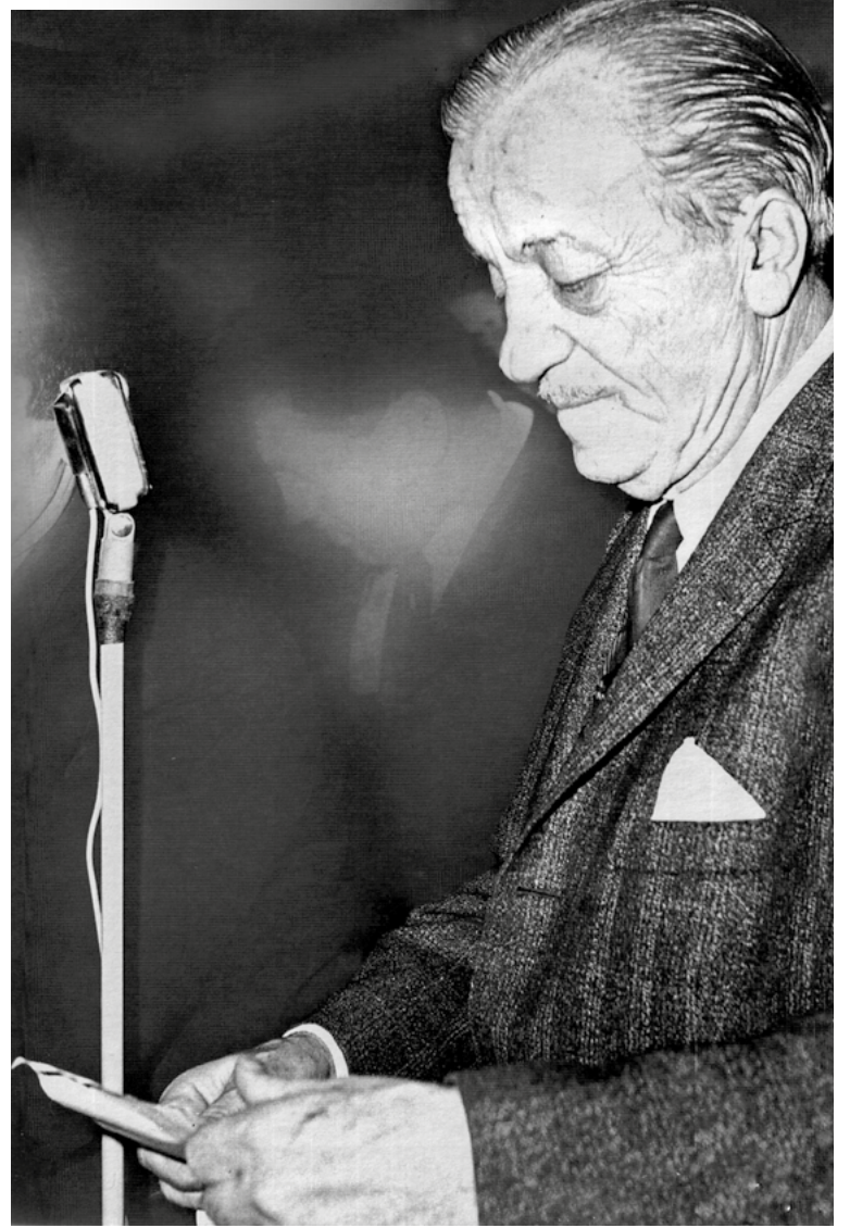
Necip Fazıl Kısakürek

Erdoğan, Necip Fazıl'dan okumaya devam etseydi bir satır sonra o kindar gençliğin hasretini öğrenecektik: "Halka değil, Hakka inanan; meclisinin duvarında 'Hakimiyet Hakkındır' düsturu-na hasret çeken..." Sorunu Meclis'in