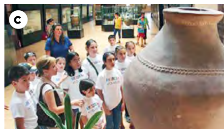
Müze'de toprak kaplar üzerinden artı ürününün büyüklüğü ve sömürüye dayalı üretim ilişkileri incelemesi a) Neolitik dönemin giderek büyüyen toprak kapları, b) Devasa boyutlarda bir toprak kap, c) Hatuşaş tapınaklarındaki binlerce ve her biri 1.750 litre ürün depolayabilen kaplarından sağlam kalan birkaçı.