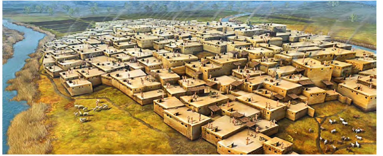
Çatalhöyük; sokakların olmadığı, sırt sırta yapılmış girişlerin damda olduğu evleriyle bin yıldan fazla eşitlikçi bir yaşama tanıklık etti.

mine ilişkin ilk bölümünde ziyaretçiyi bir sürpriz beklemektedir. Anadolu'da en eski insan kültürü için verilen tarihi ziyaretçinin algılaması için yardımcı olmanız gerekir. Bu bol sıfırlı rakam yavaş yavaş kafada şekillenir, 1 milyon yıl. Tabii ki insanlığın geçmişi çok daha eskidir, bu rakam ilk toplumların göçle Anadolu'ya gelişlerini yansıtır.