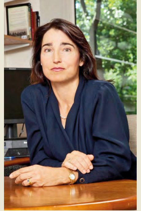
ABD Sivil Güvenlik, Demokrasi ve İnsan Hakları Bakan Yardımcısı Sarah Sewall

Tam bu sırada, Macaristan'daki "yolsuz" yetkililere ABD'ye giriş izni vermediklerini söyleyen yetkili, beklenen açıklamayı yaptı: Orta ve Doğu Avrupa'daki onlarca ABD büyükelçiliği yolsuzlukla mücadele reformlarını desteklemek ve onlarla işbirliği yapmak için "harekat planı" hazırlıyordu.