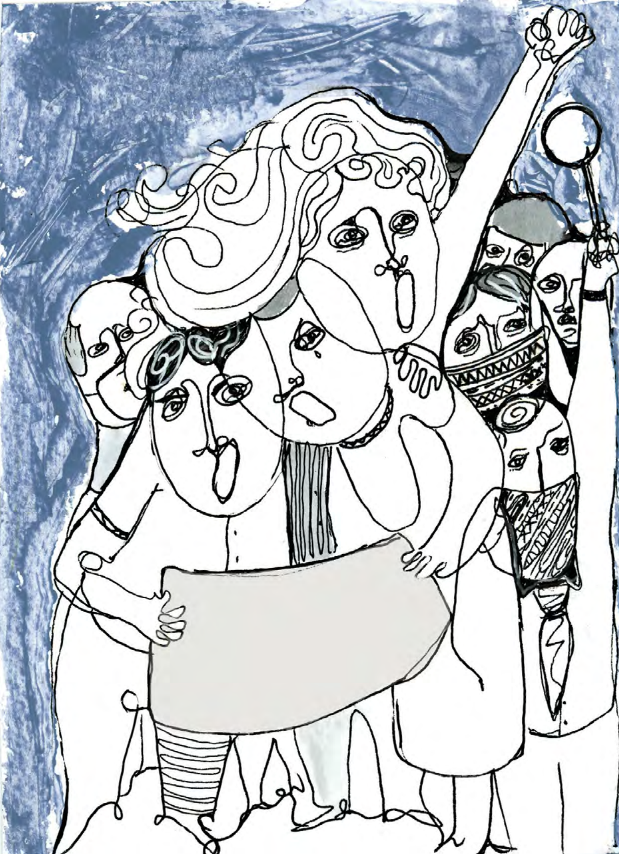
Çizim: Seda Mit

"ÇAĞRIMIZ SON DERECE AÇIK. GERİCİLİĞE KARŞI HEP BİRLİKTE ÖRGÜTLENEREK BU KARANLIKTAN ÇIKMAYI HEDEFLİYORUZ. KADINLARIN AYDINLANMA MÜCADELESİNDE HEM ELLERİ GÜÇLÜ HEM DE YOLLARI ÇOK DAHA AÇIK."