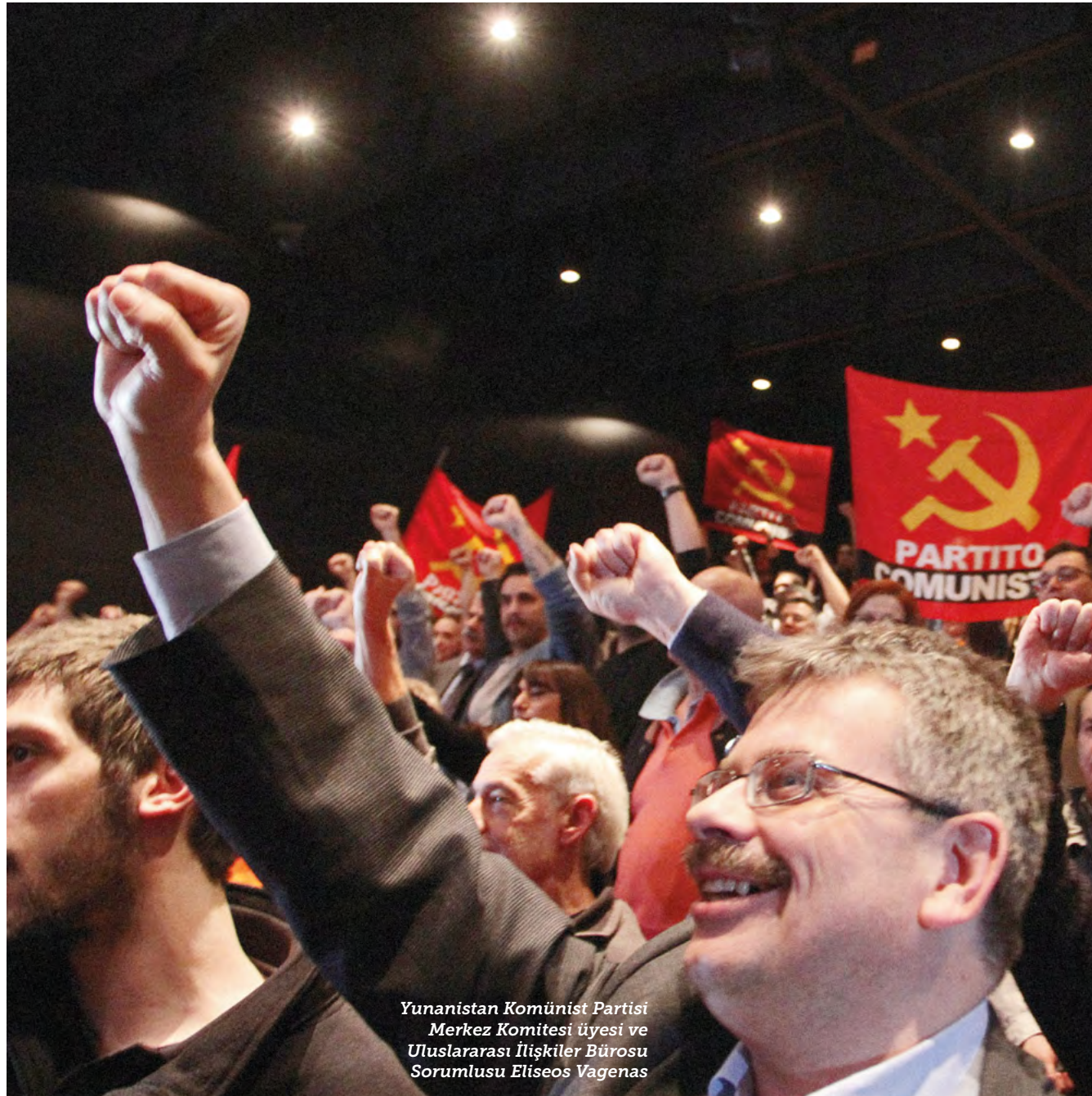
Yunanistan Komünist Partisi Merkez Komitesi üyesi ve Uluslararası İlişkiler Bürosu Sorumlusu Eliseos Vagenas

Yüzbinlerce insan fabrikalarda, gemilerde, mağazalarda, genel olarak işyerlerinde greve giderek, sokaklarda, meydanlarda ve küçük-orta çiftçilerinin barikatlarında çok temel bir mesele için