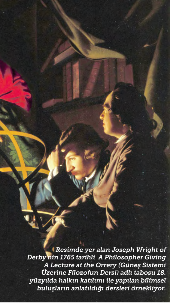
Resimde yer alan Joseph Wright of Derby'nin 1765 tarihli A Philosopher Giving a Lecture at the Orrery (Güneş Sistemi Üzerine Filozofun Dersi) adlı tabosu 18. yüzyılda halkın katılımı ile yapılan bilimsel buluşların anlatıldığı dersleri örnekliyor.

Bugün artık açıkça görüldüğü gibi, dini kurumlar, hurafeler, tanrıdan alındığı söylenen meşruiyet, kapitalizmin devamı için işçi sınıfına karşı kullanılıyor.