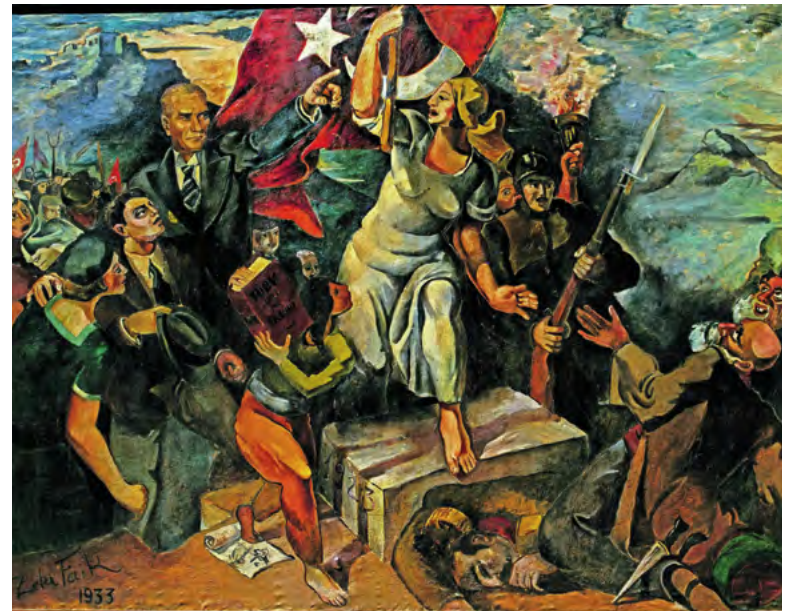
İnkılap yolunda, Zeki Faik İzer, 1933