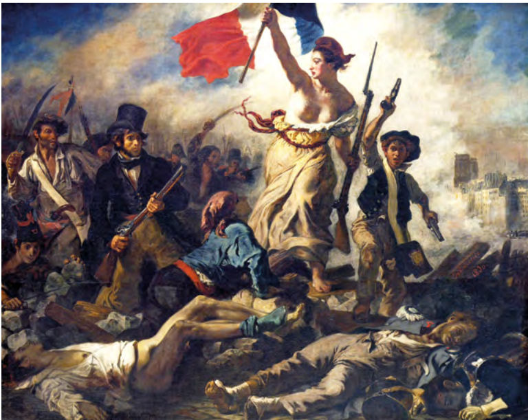
Halka yol gösteren özgürlük, Eugene Delacroix, 1830

CUMHURİYET DÖNEMİ AYDINI, ÜLKEMİZ SİYASİ TARİHİNİ ANLAMAK İÇİN ANLAŞILMASI GEREKEN İLK ŞEYLERDENDİR. BU KONUDA BİRÇOK CİDDİ TEORİK ÇALIŞMA OLDUĞUNU DA HATIRLATALIM.