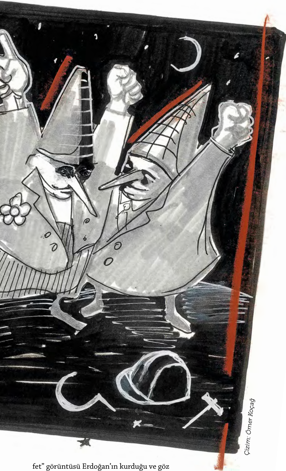
Çizim: Ömer Koçağ

Alın size eğitim listesi.. Benim zamanımda "yeni başlayanlar için" Marksist okuma programlarının ilk üç sırasını tartışmasız Politzer, Huberman ve Engels kaplıyordu. Hiç sakıncası yok. Ama benim "diğer" listemi de yabana atmayın. "Ağır" sonuçları vardır!