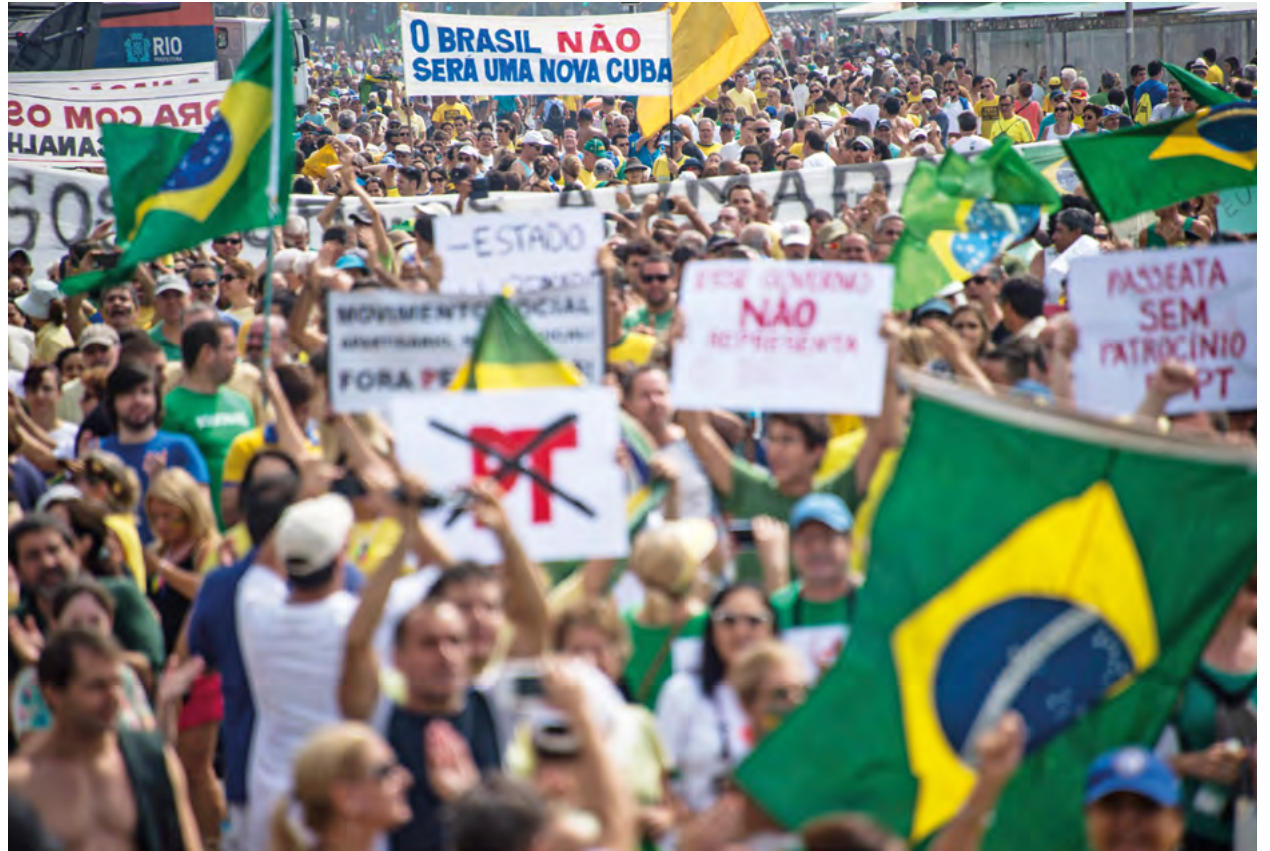
Dilma Rousseff karşıtı gösterilerde taşınan pankartlardan biri: "Brezilya yeni Küba olmayacak"

Ancak ABD'nin bölgedeki hamleleri "yumuşak diplomasi" ile sınırlı değildi. Venezuela ve Brezilya başta olmak üzere pek çok Latin Amerika ülkesinde ABD çeşitli yöntemlerle iktidar değişikliği için zemin yaratmaya çalışıyordu. Venezuela'da Chavez'in ardından gelen Nicolas Maduro'yu da seçimlerle götürmeyi başaramayan ABD, ekonomik yaptırımlar ve ülkede yarattığı kıtlıklarla istikrarsızlık yaratmaya çalıştı ve bunu büyük oranda başardı. Örneğin, The Intercept tarafından yayımlanan belgeler, ABD'nin bu amaçla Venezuela'nın ana gelirlerinden biri olan petrol endüstrisini sabote etmeye çalıştığını gösteriyordu. ABD Ulusal Güvenlik Kurumu (NSA), binlerce Venezuela hükümeti çalışanına karşı casusluk yürüterek, yönetimi değiştirmek için deneyebileceği her şeyi deniyordu. Brezilya'da da benzer şekilde Dilma Rousseff dahil olmak üzere pek çok üst düzey isim ABD tarafından dinleniyor,