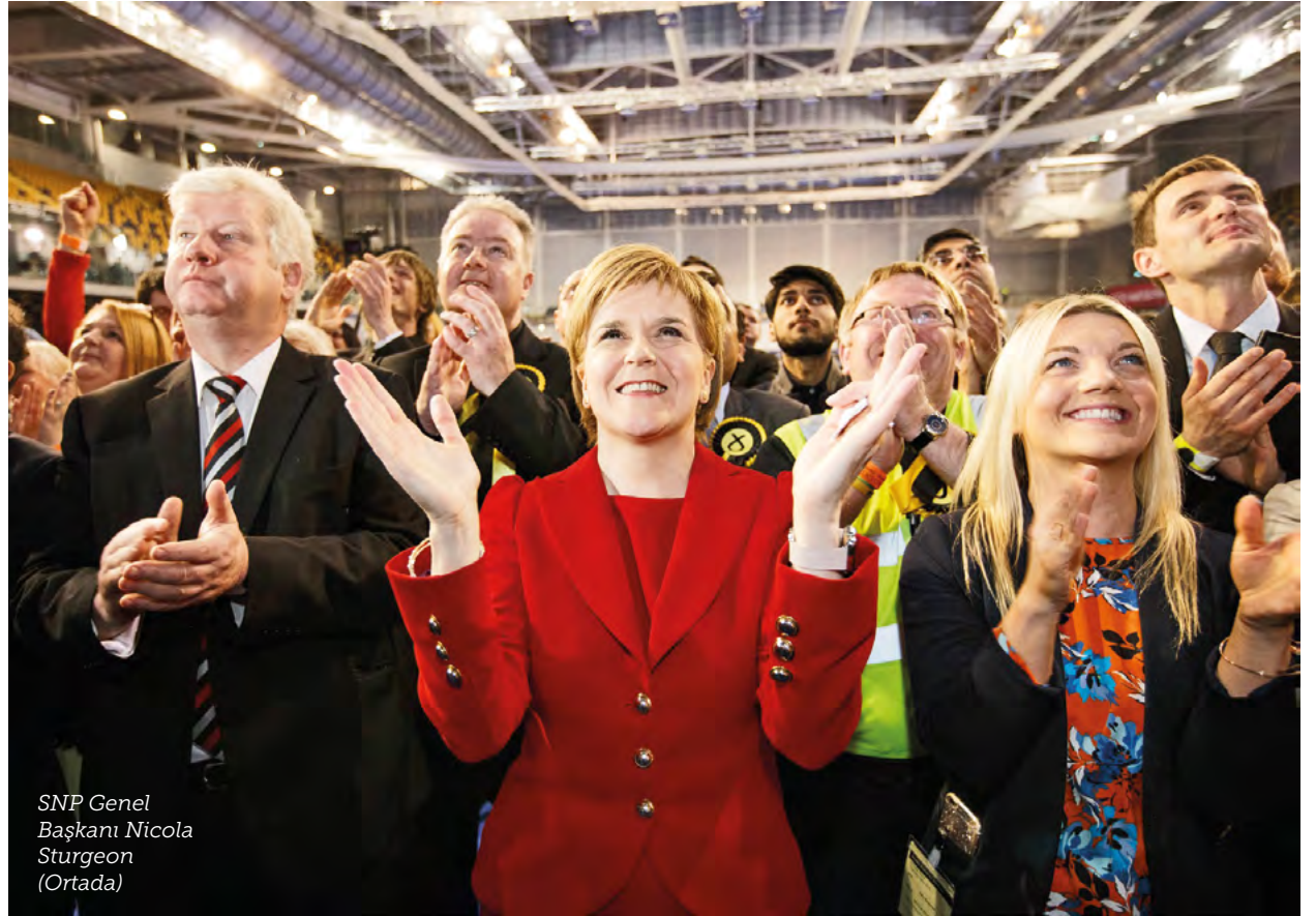
SNP Genel Başkanı Nicola Sturgeon (Ortada)

pılacak eyalet seçimlerinden beklenenin de ötesinde bir hezimete uğrayabileceğini düşünen SPD yönetimi, sosyal adalet ataklarıyla ve özeleştirilerle durumu kurtarmaya çalışıyor. Geçen haftaki bir kamuoyu yoklaması (Infrates/dimap), şimdi Berlin'de seçim olsa, SPD'nin yüzde 23, Yeşiller'in yüzde 18, Sol Parti'nin yüzde 16 oy alabileceğini gösteriyor. Sağ popülist AfD ise daha şimdiden yüzde 15'i bulmuş durumda. Asıl acısı, ki Angela Merkel'i her an başbakanlık koltuğundan edebilecek bir gelişme bu, Hıristiyan Demokrat Birliği'nin (CDU) oyların en fazla yüzde 19'unu alabilmesi. Yükselen AfD, önümüzdeki aylarda Berlin'de herkesi şaşırtan bir sonuç alabileceğini şimdiden ilan ediyor.