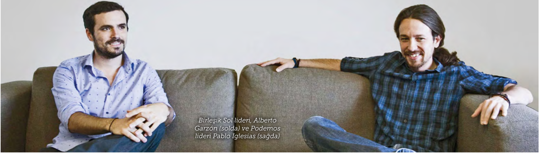
Birleşik Sol lideri, Alberto Garzón (solda) ve Podemos lideri Pablo Iglesias (sağda)

İSPANYA'NIN ÖFKELİLERİ AVRUPA'DA BAZEN POPÜLİST SAĞ PARTİLERLE BAZEN YENİ SOSYAL DEMOKRAT HAREKETLERLE KENDİNİ GÖSTEREN 'KURULU DÜZEN' KARŞITLIĞINA OTURUYOR. ÖFKELİ DÜZEN KARŞITLIĞI İDDİALARININ AKSİNE KAPİTALİST DÜZENLE HESAPLAŞMADAN KAÇIYOR, BİR YENİ 'DÜZEN' OLAN SOSYALİZME DE MESAFELİ DURUYOR.