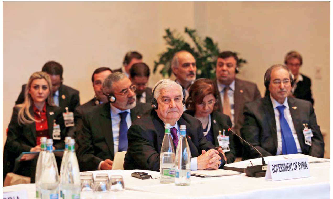
Cenevre Konferansı'nda konuşan Suriye Dışişleri Bakanı Velid Muallim uluslararası camiadan Suriye'ye silah akışını durdurmasını ve terörizmi desteklemeyi bırakmasını istedi.

Öncelikle Suriye'de hangi gruba hangi silahların sağlanacağını, Türkiye'deki CIA ajanlarının kontrol ettiğini 2012'de hem Washington Post hem de New York Times gibi ABD yönetiminin gayri-resmi yayın organları açıkça yazmıştı. Zara'daki katliamdan bir gün önce ise ABD, Rusya'nın Ahrar'uş Şam'ın terör örgütü ilan edilmesine yönelik BMGK'ya sunduğu karar tasarisını veto etmişti. Bu tabloya bakılınca "Cenevre sürecinin sabotajını ABD mi istedi?" sorusuna evet yanıtı verilebilir ancak durum böyle değil. ABD, Cenevre'deki masanın tümüyle devrilmesine neden olacak Suudi Arabistan'ın 'B planlarına' bugüne kadar olur vermedi ancak Şam yönetiminin Esad'ın istifasına direnmesini sağlayan mevcut avantajlı pozisyonunun da altını oymaya çalışıyor. Bu nedenle Suudi Arabistan ve Türkiye'nin ortak imzasını taşıyan provokasyonlar, 'çok aşırıya gitmedikleri' müddetçe ABD'nin de menfaatine bir durum yaratıyor.