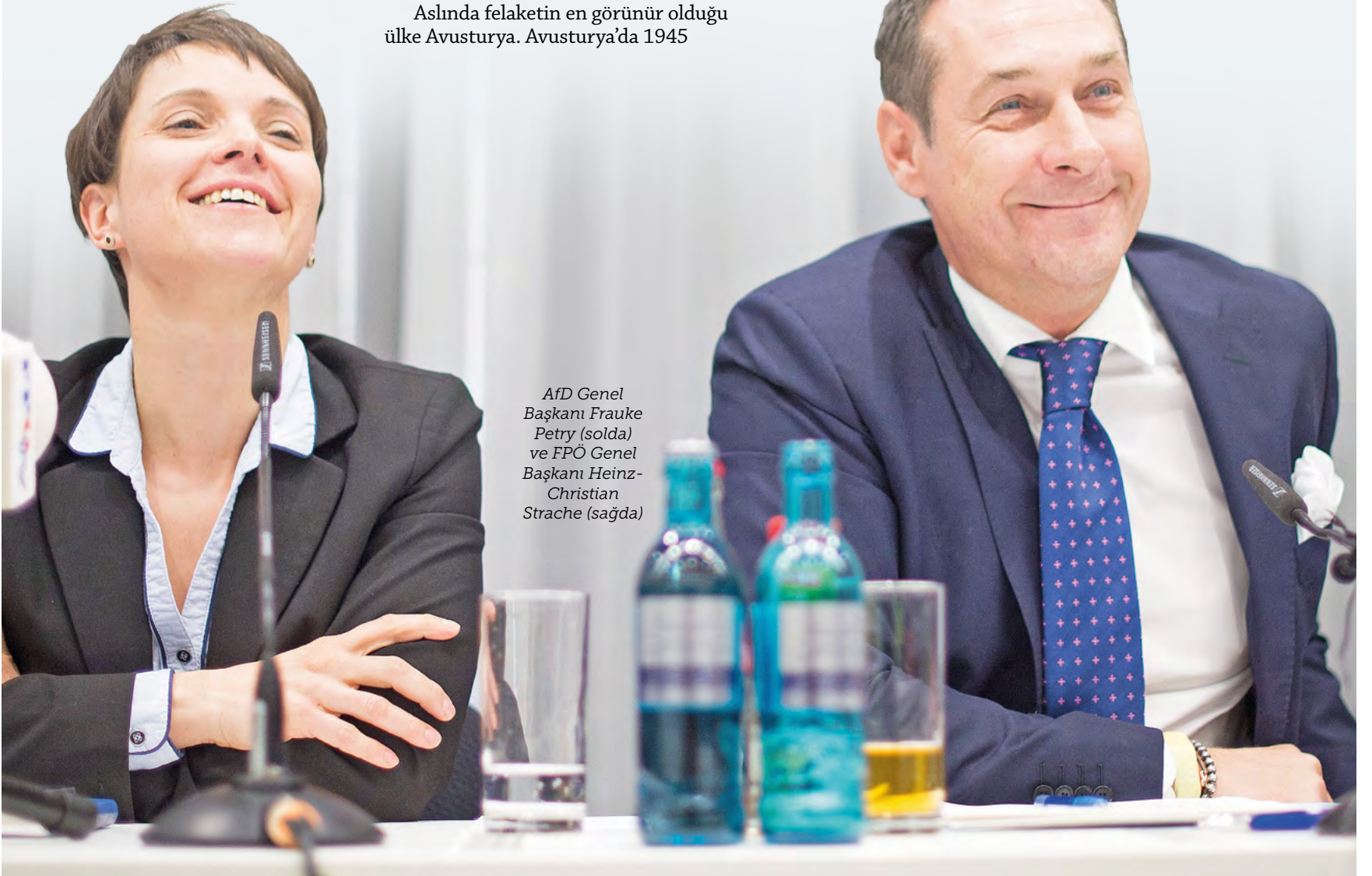
AfD Genel Başkanı Frauke Petry (solda) ve FPÖ Genel Başkanı Heinz-Christian Strache (sağda)

sonrasında iktidardan neredeyse hiç kopmamış sosyal demokrasi ve partisi, Avusturya Sosyal Demokrasi Partisi (SPÖ), bitmek üzere. Bir “Blair-Schröder döküntüsü” olarak resmedilen “kaçak başbakan” Werner Faymann döneminde, SPÖ, tam 18 seçimden art arda oy yitirerek çıktı; yolun sonunu bulmuş görünüyor. Dolayısıyla açık faşizme kapıları açık bir “sağ popülist” parti olarak