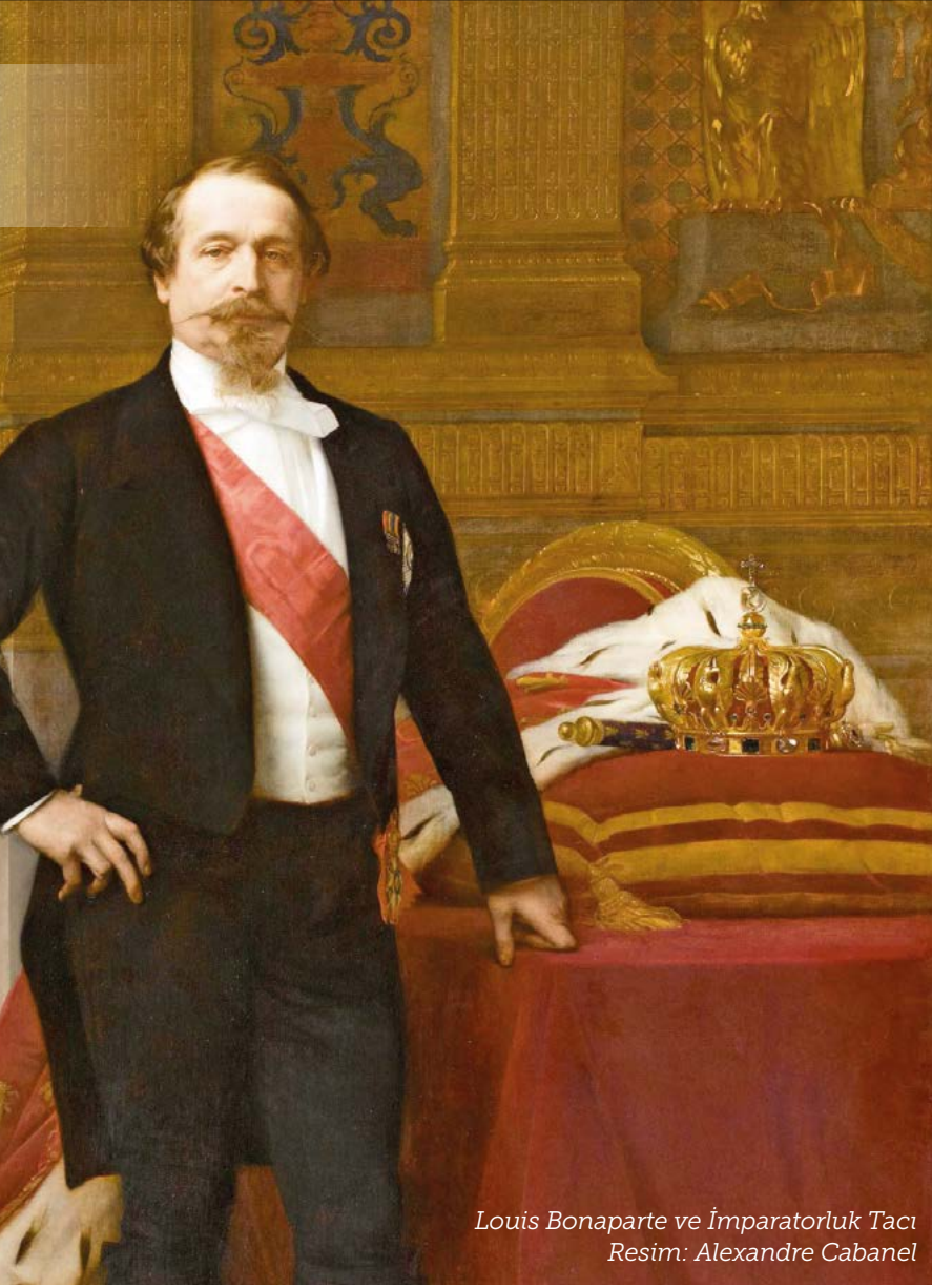
Louis Bonaparte ve İmparatorluk Tacı Resim: Alexandre Cabanel

de Fransa'da Devrim Takvimi yürürlükteydi. Jakobenler, miladını 1792'de Cumhuriyetin ilanı olarak alan, dini ve aristokratik terimlerin çoğunlukla doğadan alınma seküler isimlerle değiştirildiği bir takvim benimsişlerdi. Tarih 8. Cumhuriyet yılının "Sis" ayınının 18. Günüdür: 18 Brumaire VIII. Bu nedenle Napoléon'un hükümete el koymasını 18 Brumaire darbesi olarak anılır. I. Napoléon, 15 yıl süren Napoléon savaşları ile Avrupa'yı kasıp kavurup, fethettiği topraklara devrimin rüzgârını götürdükten ve tabii bu arada Roma tacı takarak imparatorluğunu ilan ettikten sonra, 1814'te Waterloo yenilgisiyle Avrupa tarihindeki rolünü tamamlamış oldu.