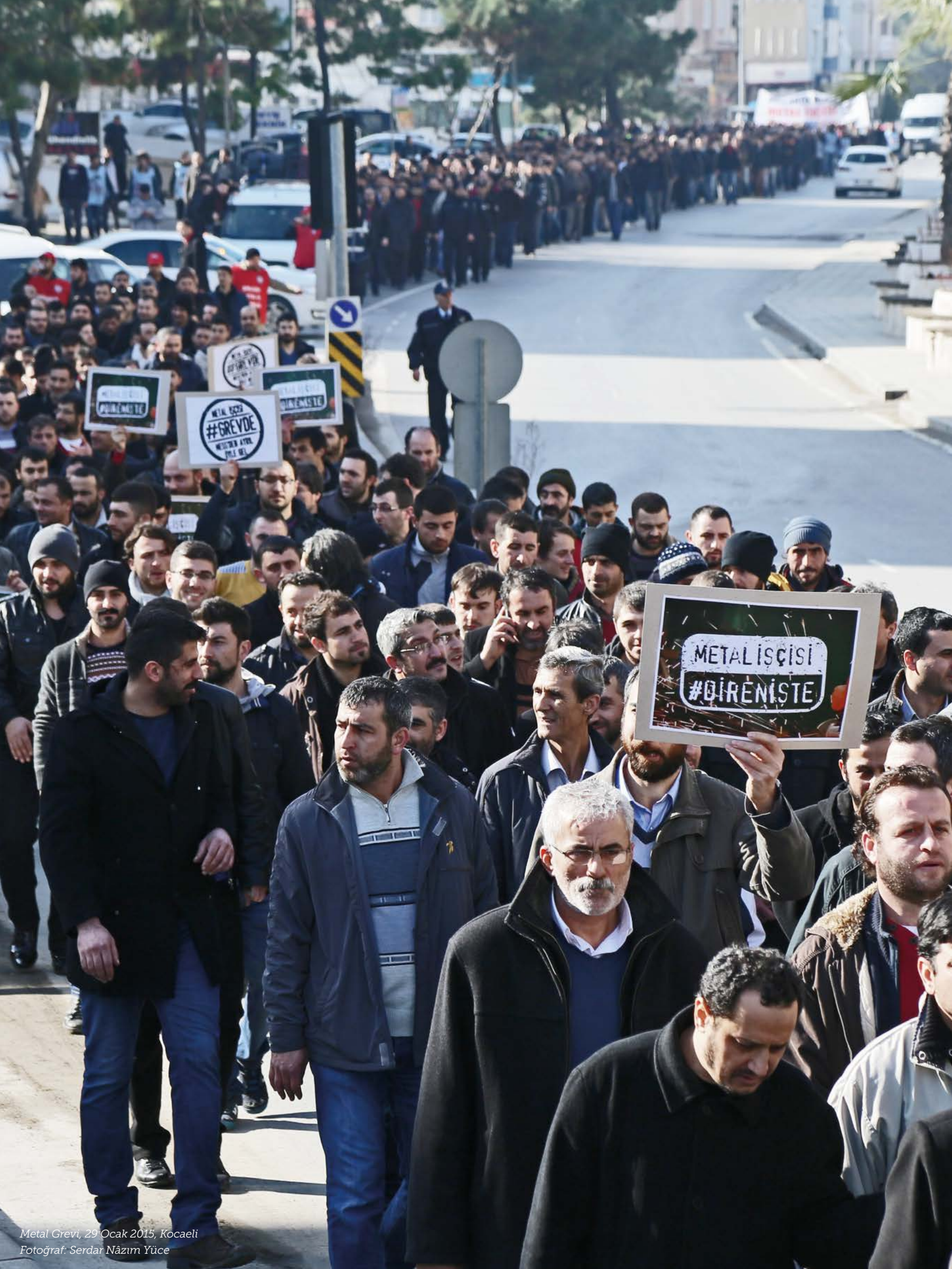
Metal Grevi, 29 Ocak 2015, Kocaeli